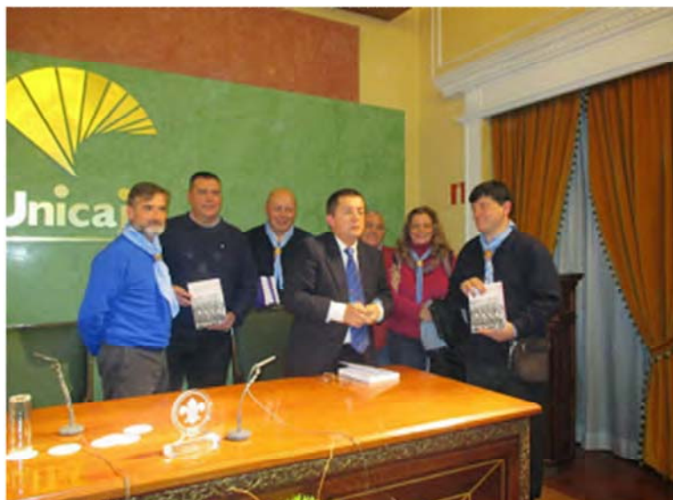
Representación de AISG Málaga, G-44 AL-ANDALUS con el autor

Tras las presentaciones, el autor nos deleito y comentó en pinceladas su libro, con algunas de las curiosidades del mismo, con los inicios y la formación de las patrullas de Exploradores. Aquellas personas que, como mecenas, ayudaron e impulsaron el movimiento y aquellas primeras salidas.