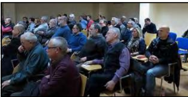
Vista parcial del público asistente

En la programación de actividades de una Ex-filna en Asturias no podía faltar una espicha y aquí también la hubo. Fue un buen momento para compartir unos culines de sidrina y los buenos alimentos de la tierra.